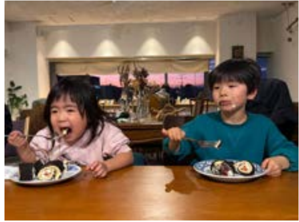
真剣な表情で苺を並べます(左) 巻いて完成したら、いただきます!(右)