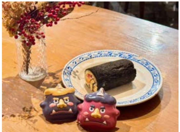
期間限定で販売も